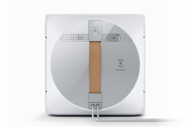
Esta imagen es solo de referencia y el color puede diferir del aspecto real del producto.

EN 60335-2-54:2008 + A11:2012 + A1:2015 EN 60335-1:2012 + A11:2014 + A13:2017 + A1:2019 + A14:2019 + A2:2019 EN 62479:2010 EN 50663:2017 EN 62233:2008 EN 61558-1:2005 + A1:2009 EN 61558-2-16:2009 + A1:2013 EN 55014-1:2017 EN 55014-2:2015 EN 61000-3-2:2019 EN 61000-3-3:2013 + A1:2019 EN 300 328 V2.2.2 EN 301 489-1 V2.2.3 EN 301 489-17 V3.2.4 EN 50564: 2011