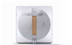
Это изображение приведено в ознакомительных целях, цвет может отличаться от фактического внешнего вида изделия.

EN 60335-2-54:2008 + A11:2012 + A1:2015 EN 60335-1:2012+A11:2014+A13:2017+A1:2019+A14:2019+A2:2019 EN 62479:2010 EN 50663:2017 EN 62233:2008 EN 61558-1:2005+A1:2009 EN 61558-2-16:2009+A1:2013 EN 55014-1:2017 EN 55014-2:2015 EN 61000-3-2:2019 EN 61000-3-3:2013+A1:2019 EN 300 328 V2.2.2 EN 301 489-1 V2.2.3 EN 301 489-17 V3.2.4 EN 50564: 2011