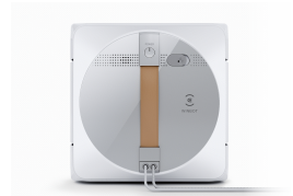
L'immagine è solo di riferimento e il colore può differire dall'aspetto reale del prodotto.

EN 60335-2-54:2008 + A11:2012 + A1:2015 EN 60335-1:2012+A11:2014+A13:2017+A1:2019+A14:2019+A2:2019 EN 62479:2010 EN 50663:2017 EN 62233:2008 EN 61558-1:2005+A1:2009 EN 61558-2-16:2009 + A1:2013 EN 55014-1:2017 EN 55014-2:2015 EN 61000-3-2:2019 EN 61000-3-3:2013 + A1:2019 EN 300 328 V2.2.2 EN 301 489-1 V2.2.3 EN 301 489-17 V3.2.4 EN 50564: 2011