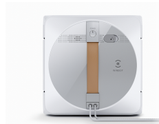
Cette image est fournie à titre de référence uniquement et la couleur peut différer de l'apparence réelle du produit.

EN 60335-2-54:2008 + A11:2012 + A1:2015 EN 60335-1:2012+A11:2014+A13:2017+A1:2019+A14:2019+A2:2019 EN 62479:2010 EN 50663:2017 EN 62233:2008 EN 61558-1:2005+A1:2009 EN 61558-2-16:2009+A1:2013 EN 55014-1:2017 EN 55014-2:2015 EN 61000-3-2:2019 EN 61000-3-3:2013+A1:2019 EN 300 328 V2.2.2 EN 301 489-1 V2.2.3 EN 301 489-17 V3.2.4 EN 50564: 2011