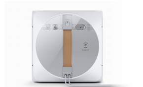
Dieses Bild dient nur als Referenz. Die Farbe kann von der tatsächlichen Farbe des Produkts abweichen.

EN 60335-2-54:2008 + A11:2012 + A1:2015 EN 60335-1:2012+A11:2014+A13:2017+A1:2019+A14:2019+A2:2019 EN 62479:2010 EN 50663:2017 EN 62233:2008 EN 61558-1:2005+A1:2009 EN 61558-2-16:2009+A1:2013 EN 55014-1:2017 EN 55014-2:2015 EN 61000-3-2:2019 EN 61000-3-3:2013+A1:2019 EN 300 328 V2.2.2 EN 301 489-1 V2.2.3 EN 301 489-17 V3.2.4 EN 50564: 2011