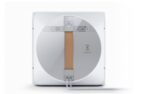
This image is for reference only and the color may differ from actual product appearance.